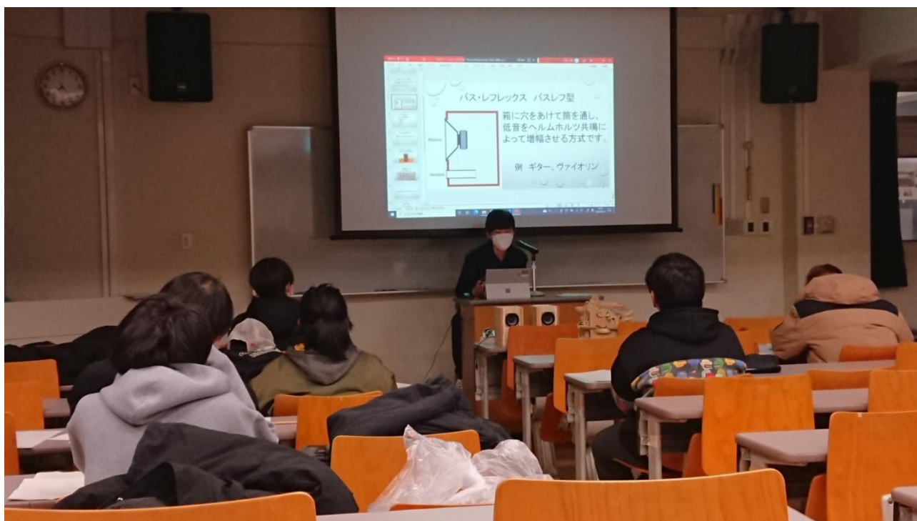
大講義室での発表会の様子

「なぜだろう?」「もっと使いやすいといいのに」「こんなものがあれば…」など、日常の疑問や希望を大切にして自分なりの課題を見つけること。その課題を解決するために、考えて、やってみて、改善して、さらに試す、を繰り返すこと。感じたこと、できたこと、できなかったことを次のステップに活かすこと。『課題研究』を通して学んだこれらのことを、社会でも活用して頑張ってもらいたいと願っています。